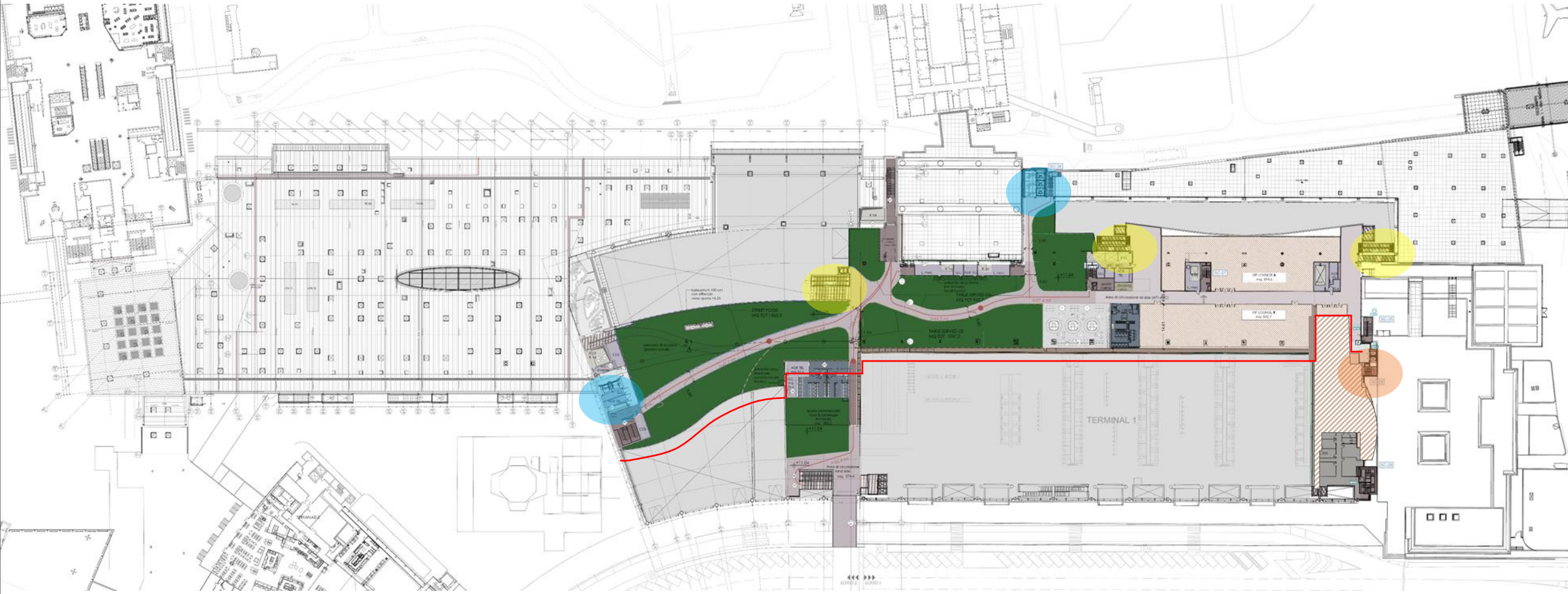
Hub Est Livello Mezzanino